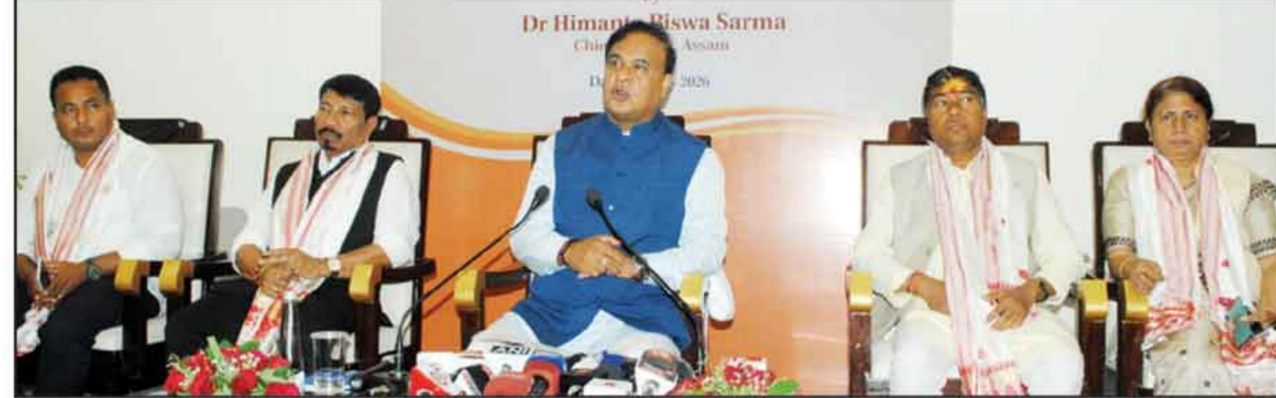
নতুন মন্ত্রিসভার প্রথম বৈঠকের পর সতীর্থদের নিয়ে সাংবাদিক সম্মেলনে মুখ্যমন্ত্রী হিমন্ত বিশ্ব শর্মা। বুধবার গুয়াহাটিতে।