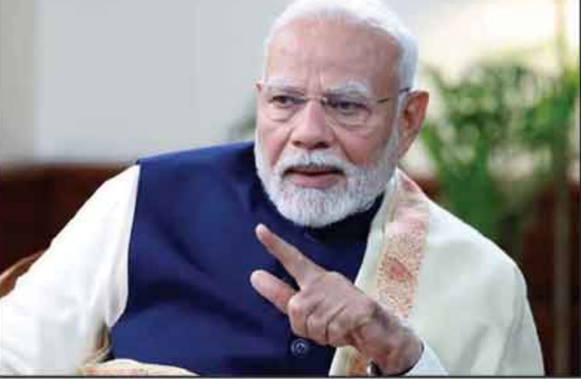
অপ্রয়োজনীয় বিদেশ সফর, সরকারি বিমানের ব্যবহার এবং জ্বালানি-নির্ভর আনুষ্ঠানিকতা কমানোর ওপরও জোর দেওয়া হয়েছে। বুধবার প্রধানমন্ত্রী নরেন্দ্র মোদি, কেন্দ্রীয় স্বরাষ্ট্রমন্ত্রী অমিত শাহ এবং প্রতিরক্ষামন্ত্রী রাজনাথ সিং তাঁদের সরকারি বাসভবন থেকে স্বাভাবিকের তুলনায় অনেক ছোট কনভয় নিয়ে এরণর ছয়ের পাতায়

নয়াদিল্লি, ১৩ মে : পশ্চিম এশিয়ায় চলমান সংঘাতের জেরে বিশ্বজুড়ে জ্বালানি সরবরাহ ও মূল্য নিয়ে উদ্বেগের মধ্যে প্রধানমন্ত্রী নরেন্দ্র মোদি দেশবাসীর প্রতি জ্বালানি সাশ্রয়ের আহ্বান জানানোর পর কেন্দ্র ও রাজ্যের রাজনৈতিক নেতৃত্ব এবং প্রশাসনিক মহলে ব্যাপক সাড়া পড়েছে। কেন্দ্রীয় মন্ত্রী থেকে শুরু করে বিভিন্ন রাজ্যের মুখ্যমন্ত্রী, বিধায়ক এবং সরকারি অধিকারিকরা নিজেদের আচরণে পরিবর্তন এনে জ্বালানি সংরক্ষণের লক্ষ্যে একাধিক বাস্তব পদক্ষেপ গ্রহণ করেছেন।