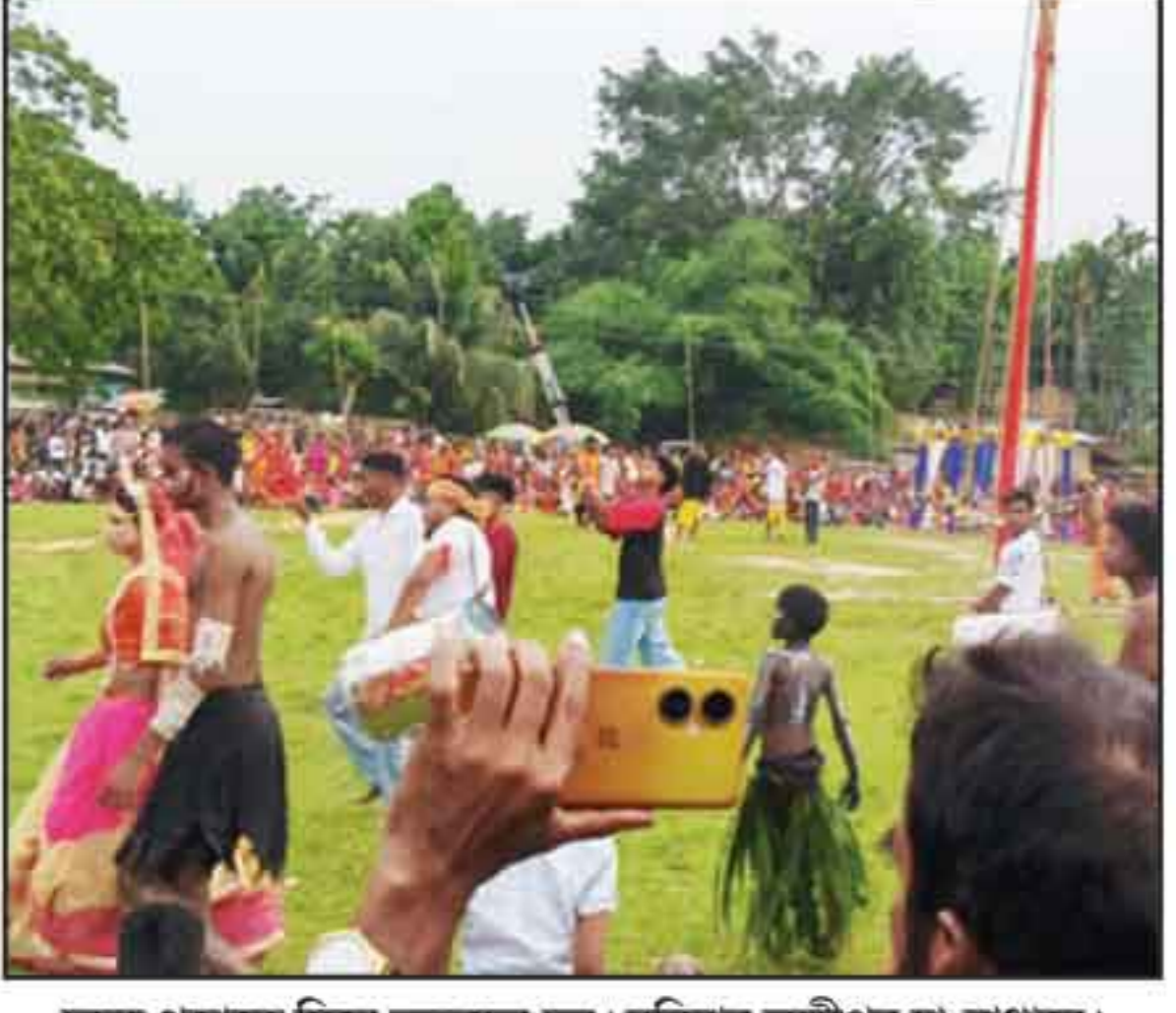
চড়ক পূজাকে ঘিরে ভক্তদের চল। রবিবার লক্ষীপুর চা-বাগানে।

পেশাকে মানবসেবার এক মহান আদর্শ হিসেবে প্রতিষ্ঠিত করেন তিনি। তাঁর জন্মদিন উপলক্ষে প্রতি বছর ১২ মে বিশ্ব নার্স দিবস পালন করা হয়। বক্তারা আরও বলেন, রোগীদের সেবার নার্সদের ভূমিকা অত্যন্ত গুরুত্বপূর্ণ। মানবিকতা, ধৈর্য ও দায়িত্ববোধ নিয়ে তারা দিন-রাত নিরলসভাবে কাজ করে গেছেন। বিশ্ব নার্স দিবস উপলক্ষে বক্তারা নার্সদের শুভেচ্ছা জানান। পাশাপাশি স্বাস্থ্যসেবার মান আরও উন্নত করতে সবাইকে একাবদ্ধভাবে কাজ করার আহ্বান জানানো হয়। তারা আরও