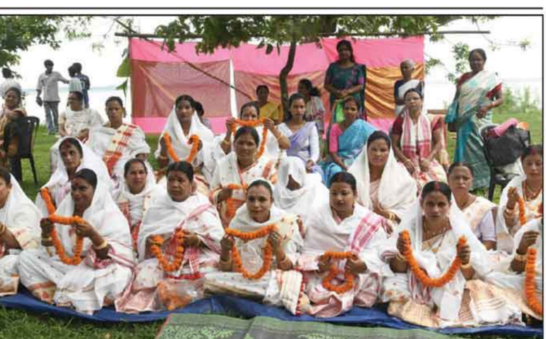
গুয়াহাটিতে গণবিবাহ অনুষ্ঠানের একটি দৃশ্য।