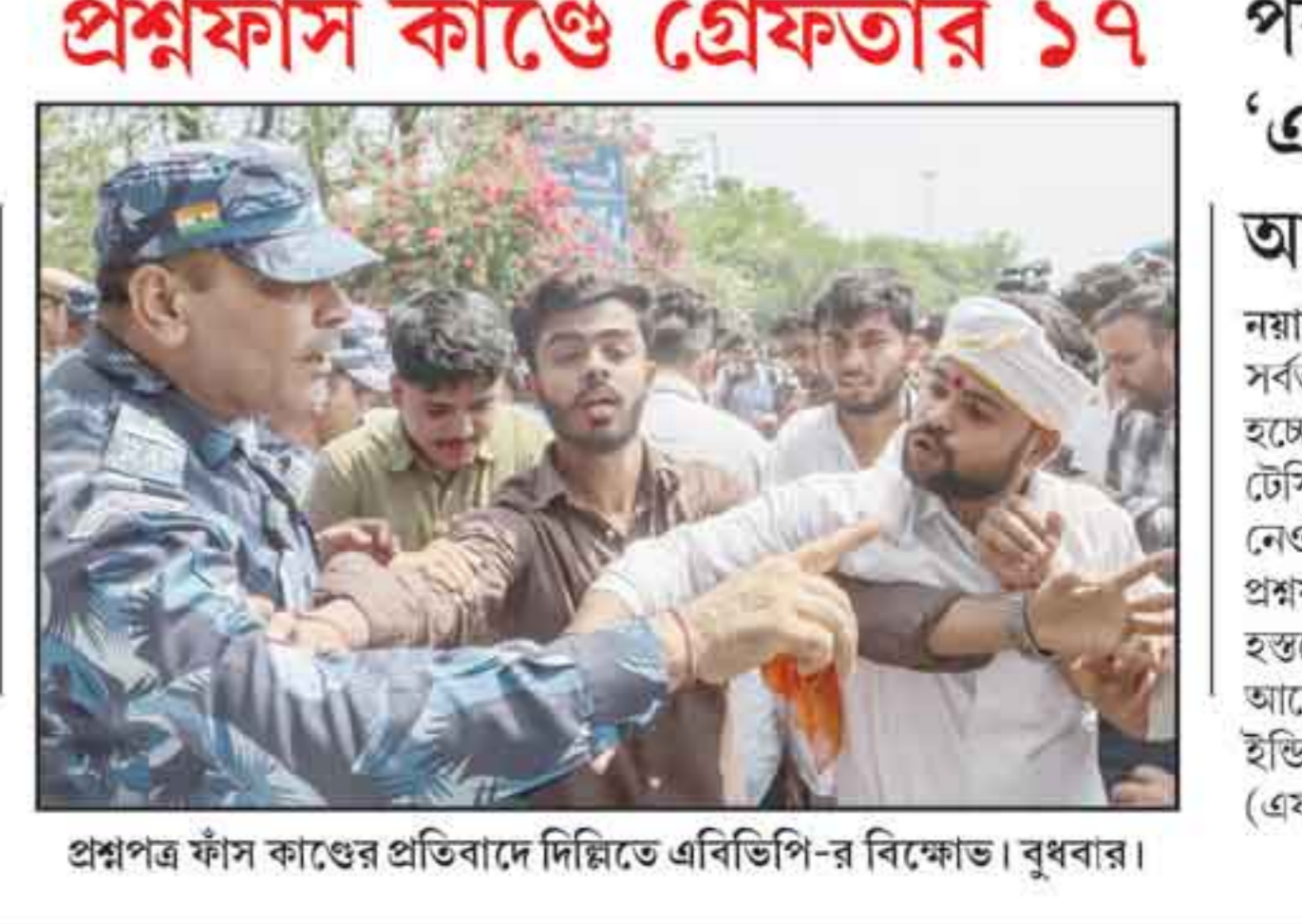
প্রশ্নপত্র ফাঁস কাণ্ডের প্রতিবাদে দিল্লিতে এবিভিপি-র বিক্ষোভ। বুধবার।

নয়াদিল্লি, ১৩ মে : নিট ইউজি প্রশ্নপত্র ফাঁসের জেরে হেনস্তার শিকার দেশজুড়ে ২২ লক্ষ পরীক্ষার্থী। এবার তদন্ত সূত্রে উঠে এল, মহারাষ্ট্রের নাসিক থেকে ১০ লক্ষ টাকায় নিট-র প্রশ্নপত্র কিনে ১৫ লক্ষ টাকায় তা হরিয়ানায় বিক্রি করা হয়। জানা গিয়েছে, কেলেঙ্কারির সূত্রপাত হয় নাসিক শহরে। সেখানকার প্রশ্নপত্রের প্রথম ডিজিটাল কপি হস্তান্তর হয়।