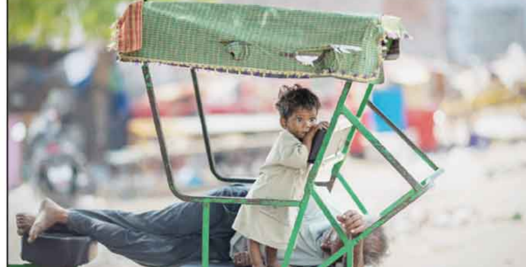
বিপন্ন শৈশব। দাবাদাহের দিল্লিতে মঙ্গলবার।

মারণ আঘাত হেনেছে প্রতিবেশী পাকিস্তান। প্রতিবার মিলেছে যোগ্য জবাবও। অতীতে প্রতিটি সরকার পাকিস্তানের সঙ্গে সম্পর্ক উন্নতির চেষ্টা করে গিয়েছেন। আর প্রতিবারই পিছন থেকে ছুরি চালিয়েছে জিহাদ-র দেশ। মোদি জমানাতেও পাক সন্ত্রাস রক্তাক্ত করেছে ভারতকে। সবশেষে গত বছর পহেলগাঁও জঙ্গি হামলার পর পাকিস্তানের সঙ্গে যাবতীয় সম্পর্ক কার্যত ছিন্ন করেছে ভারত। বাণিজ্য থেকে ভিসা আদানপ্রদান, এমনকী বাতিল করে দেওয়া হয়েছে নেহরু জমানার সিদ্ধ জলচুক্তি। যার জেরে রীতিমতো বিপাকে ইসলাহাবাদ। পাকিস্তানের বিরুদ্ধে কঠোর পদক্ষেপ করা হলেও আলোচনার রাস্তা খোলা রাখার পক্ষেই মত দিল আরএসএস।