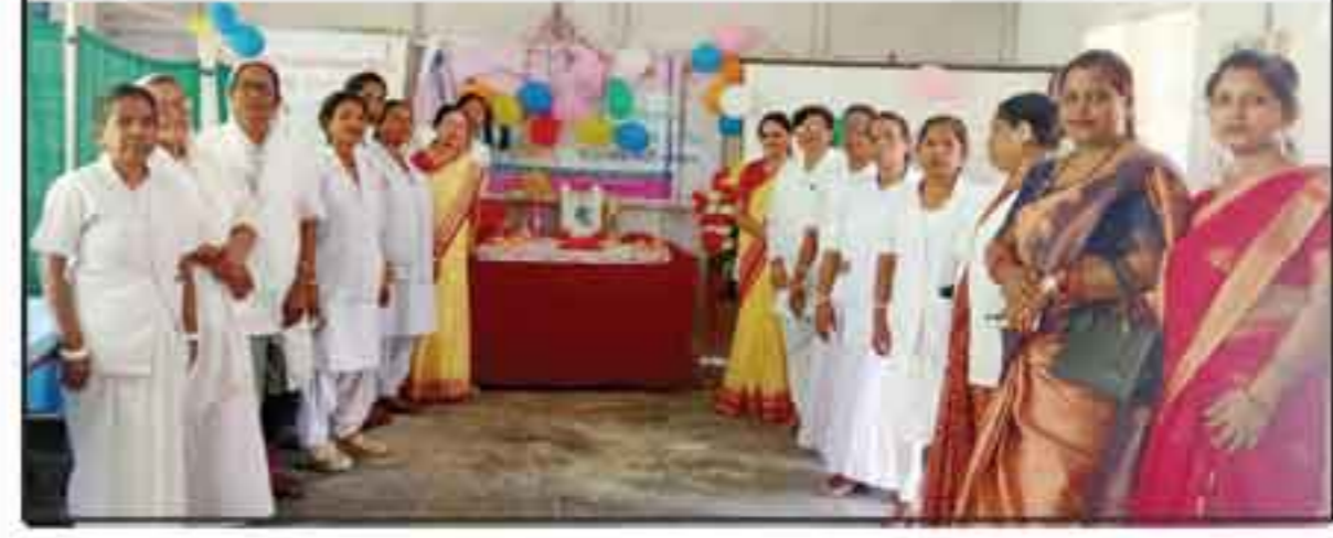
কাটলিছড়া প্রাথমিক স্বাস্থ্যকেন্দ্রে আন্তর্জাতিক নার্স দিবস পালন।

সাময়িক প্রসঙ্গ, কাটলিছড়া, ১৩ মে : রোগীর গুণস্বার্থে শুধু পেশা নয়, এটি মানবতার এক নিঃশব্দ সাধনা, এই বার্তাকেই সামনে রেখে কাটলিছড়া প্রাথমিক স্বাস্থ্যকেন্দ্রে মঙ্গলবার মর্যাদা ও আন্তরিকতার আবহে উদযাপিত হল আন্তর্জাতিক নার্স দিবস। স্বাস্থ্যকর্মীদের প্রতি শ্রদ্ধা, মানবসেবার অঙ্গীকার এবং ফ্লোরেন্স নাইটিংগেলের আদর্শকে স্মরণ করে দিনভর নানা কর্মসূচির আয়োজন করা হয় হাসপাতাল প্রাঙ্গণে।