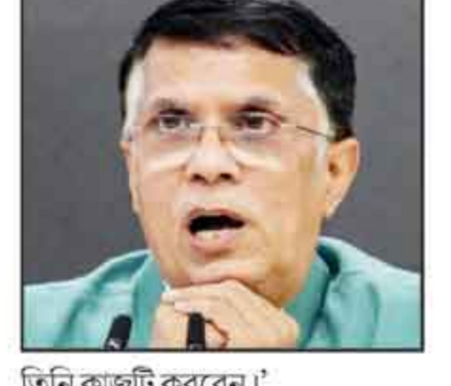
তিনি কাজটি করবেন। গত ৫ এপ্রিল পবন খেড়া এক সাংবাদিক সম্মেলনে দাবি