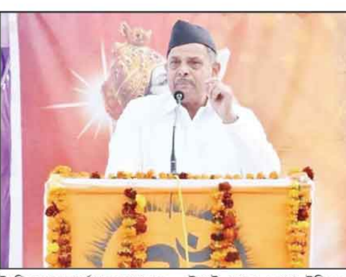
উন্নতিতে গুরুত্বপূর্ণ পদক্ষেপ নেবে। কারণ আমাদের মধ্যে সাংস্কৃতিক বন্ধন রয়েছে। একটা সময় আমরা একই জাতির ছিলাম। এই বিষয়ের উপরই জোর দেওয়া উচিত দুই পক্ষের। উল্লেখ্য, ভারত থেকে বিচ্ছিন্ন হওয়ার পর বারবার ভারতের বিরুদ্ধে

পুরোপুরি বন্ধ রাখা উচিত নয় আমাদের। ওদের (পাকিস্তান) সঙ্গে আলোচনার জন্য সর্বদা প্রস্তুত থাকতে হবে আমাদের। পাশাপাশি আরএসএসের সাধারণ সম্পাদক বলেন, 'দুই দেশের মধ্যে চলমান অচলাবস্থা ভাঙতে সবচেয়ে বেশি গুরুত্বপূর্ণ হল দুই দেশের জনগণের মধ্যে যোগাযোগ। এই মুহূর্তে সেই পথই অনুসরণ করা উচিত।' প্রচলিত কূটনৈতিক চ্যানেলের বাইরে 'ট্যাক টু' কূটনীতি নিয়ে সরকার নীরব থাকলেও, বিরোধী দলের নেতা-সহ বহু বিশিষ্টজন দুই দেশের সূশীল সমাজের মধ্যে কথাবার্তা চালিয়ে যাওয়ার পক্ষে মত দিয়ে এসেছেন। এই প্রসঙ্গে আরএসএস নেতা বলেন, 'আমি মনে করি এটিই একমাত্র আশা, আমি দুইভাবে বিশ্বাস করি শেষ পর্যন্ত সূশীল সমাজই দুই দেশের সম্পর্কের