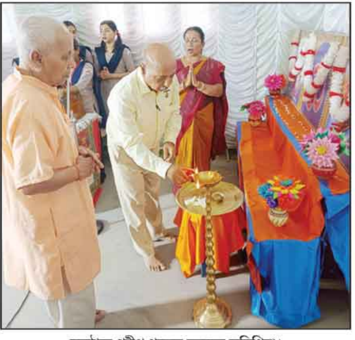
অনুষ্ঠানে প্রদীপ প্রজ্জ্বলন করছেন অতিথিরা।

সাময়িক প্রসঙ্গ, শিলচর, ১৩ মে : ২০২৫-২৬ শিক্ষাবর্ষের মাধ্যমিক-সহ অঙ্কুর থেকে নবম শ্রেণির কৃতী বিদ্যার্থীদের সংবর্ধনা জ্ঞাপন করল সরস্বতী বিদ্যালয়কেতন, দক্ষিণ শিলচর। মঙ্গলবার বিকেল সাড়ে চারটায় এ উপলক্ষে বিদ্যালয়ে এক অনুষ্ঠান আয়োজন করে কৃতীদের সম্মাননা প্রদান করা হয়। উল্লেখ্য, সংশ্লিষ্ট শিক্ষাবর্ষের মাধ্যমিক পরীক্ষায় প্রথম বিভাগে উত্তীর্ণ এবং বিদ্যালয়ের বার্ষিক পরীক্ষায় অঙ্কুর থেকে নবম শ্রেণির প্রথম স্থানীয়কারী-সহ সর্বোচ্চ উপস্থিতি থাকা বিদ্যার্থীদের