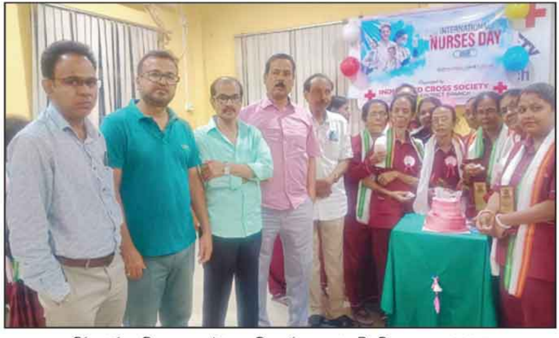
সংবর্ধিত নার্সদের নিয়ে কেক কাটার একটি মুহূর্ত। মঙ্গলবার শ্রীভূমি রেডক্রস হাসপাতালে।