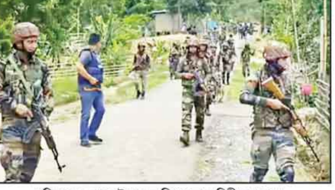
গুলিকাণ্ডের পর ঘটনাস্থলে নিরাপত্তা বাহিনী। বুধবার।

ইক্ষল, ১৩ মে : মণিপুরে অশান্তি থামার অজ্ঞাত পরিচয় একাধিক গুলিবিদ্ধ করে। এর জেরে গুলিবিদ্ধ হয়ে অস্ত্র ও যাজকের মৃত্যু হয়েছে। এই হত্যাকাণ্ডের ফলে কোভিড ফেটে পড়েছে স্থানীয় জনতা। জাতীয় সড়ক ২ অবরোধ করে বিক্ষোভ দেখান তাঁরা।