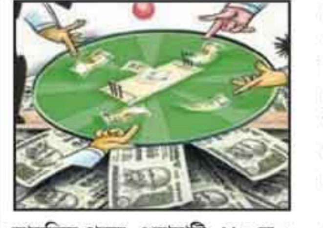
সাময়িক প্রসঙ্গ, গুয়াহাটি, ২৮ মে : আইপিএল ক্রিকেটকে কেন্দ্র করে অসমজুড়ে গড়ে ওঠা বিশাল অর্থাভেদ বেটিং চক্রের বিরুদ্ধে বড়সড় অভিযান চালিয়ে চাপল্যা স্ট্রিকি করেছে এনফোর্সমেন্ট ডিরেক্টরেট (ইডি)। গুয়াহাটি, তিনসুকিয়া এবং দিল্লিতে একযোগে অভিযান চালিয়ে নগদ ১৩ লক্ষ টাকা, গুরুত্বপূর্ণ ডিজিটাল তথ্য, একাধিক ব্যাঙ্ক আ্যাকাউন্ট এবং তিনটি বিলাসবহুল গাড়ি বাজেয়াপ্ত করেছে তদন্তকারী সংস্থা। তদন্ত ওঠে