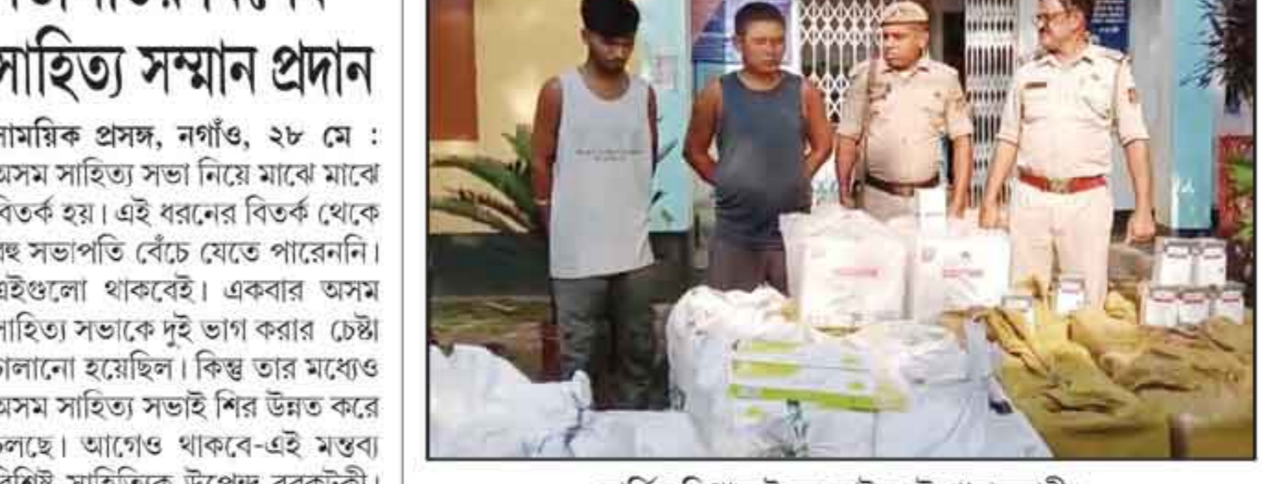
বার্মিজ সিগারেট সহ আটক দুই পাচারকারী।