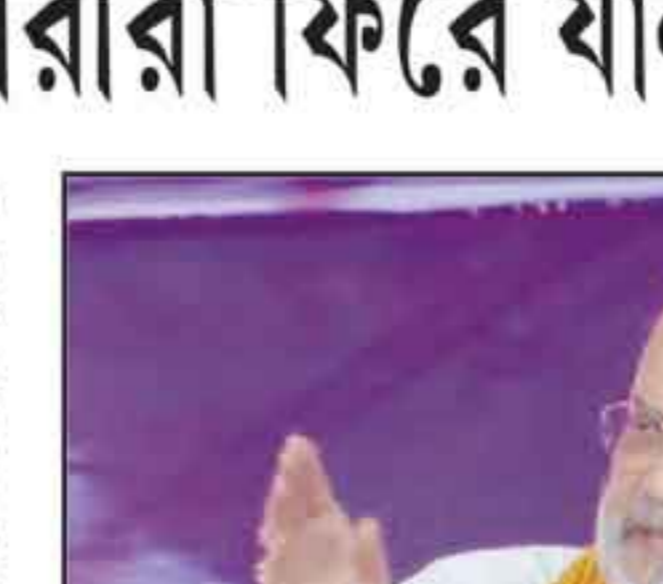
গান্ধীনগরের অনুষ্ঠানে বক্তব্য রাখছেন স্বরাষ্ট্রমন্ত্রী অমিত শাহ। বৃহস্পতিবার।

গান্ধীনগর, ২৮ মে : পশ্চিমবঙ্গে নতুন সরকার ক্ষমতায় আসার পর শত শত মানুষ রাজ্য ছেড়ে বাংলাদেশে ফিরে যাচ্ছেন। যেহেতু অনুপ্রবেশকারীরা নিজেরাই ফিরে যাচ্ছেন, তাই সরকার তাদের বিরুদ্ধে কোনও আইনি ব্যবস্থা নেবে না। এই কথা ঘোষণা করে কেন্দ্রীয় স্বরাষ্ট্রমন্ত্রী অমিত শাহ বলেন, 'শুভেচ্ছা অধিকারীর নেতৃত্বাধীন বিজেপি সরকার ডিটেনশন সেন্টার তৈরি করেছে। ডিটেন্স, ডিফিট অ্যান্ড ডিপোর্ট নীতির অংশ হিসেবে ওইসব সেন্টার বা ক্যাম্প চালু করা হয়েছে। তবে আমরা চাই, যারা অবৈধভাবে অনুপ্রবেশ করেছে তারা যেন স্বেচ্ছায়