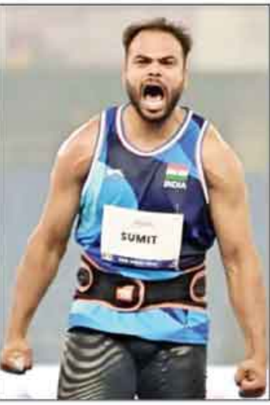
নয়াদিল্লি, ২৮ মে : আবারও ইতিহাস গড়লেন ভারতের তারকা প্যারা জ্যাভলিন শ্রোয়ার সূমিত আন্তিল। অষ্টম ইন্ডিয়ান ওপেন আন্তর্জাতিক প্যারা অ্যাথলেটিক্স চ্যাম্পিয়নশিপে পুরুষদের জ্যাভলিন শ্রো এফ-৬৪