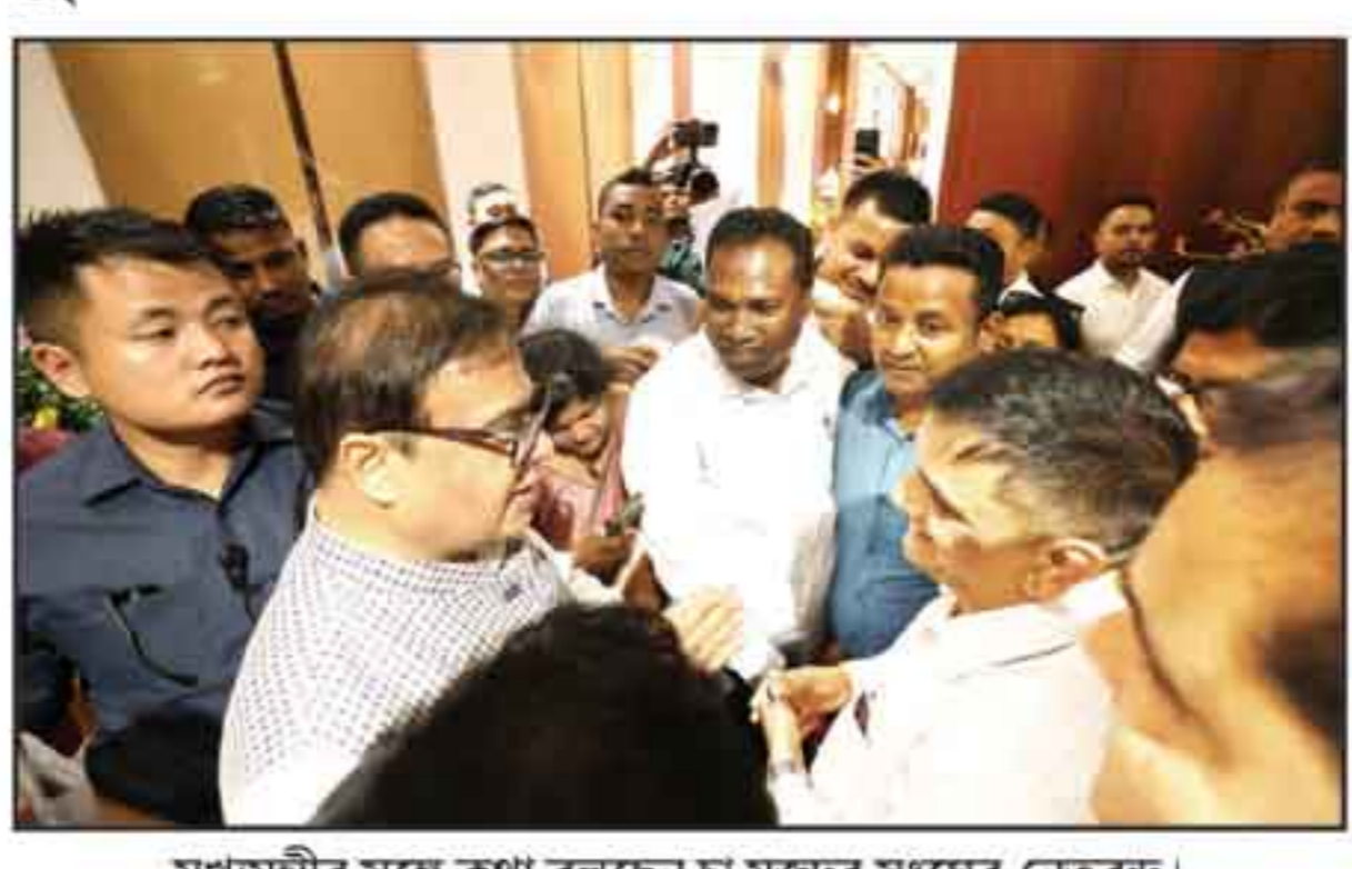
মুখ্যমন্ত্রীর সঙ্গে কথা বলছেন চা মজদুর সংঘের নেতৃবৃন্দ।

সাময়িক প্রসঙ্গ, শিলকুড়ি, ২৮ মে : ভারতীয় চা মজদুর সংঘ, বরাক ভ্যালি ইউনিটের পক্ষ থেকে একটি প্রতিনিধি মণ্ডল অসমের মুখ্যমন্ত্রী ড. হিমন্ত বিশ্ব শর্মা এবং শ্রম কল্যাণ মন্ত্রীর সঙ্গে সাক্ষাৎ করে এবং বরাক উপত্যকার চা-বাগান শ্রমিকদের কল্যাণ ও উন্নয়ন সম্পর্কিত বিভিন্ন গুরুত্বপূর্ণ দাবি-দাওয়া তাদের সামনে তুলে ধরে। গত মঙ্গলবার প্রতিনিধি মণ্ডলের পক্ষ থেকে উত্থাপিত প্রধান দাবিসমূহ হলো, বরাক উপত্যকার চা-বাগান শ্রমিকদের জন্য সমান দৈনিক মজুরি নিশ্চিত করা। সমস্ত চা-বাগানে ঘোষিত সংশোধিত মজুরি অবিলম্বে কার্যকর করা। লসাই চা-বাগানে সংশোধিত মজুরি দ্রুত বাস্তবায়ন করা। সাব-স্টাক কর্মচারীদের বেতন পুনর্বিবেচনা ও বৃদ্ধি করা। অন্তঃপোষ