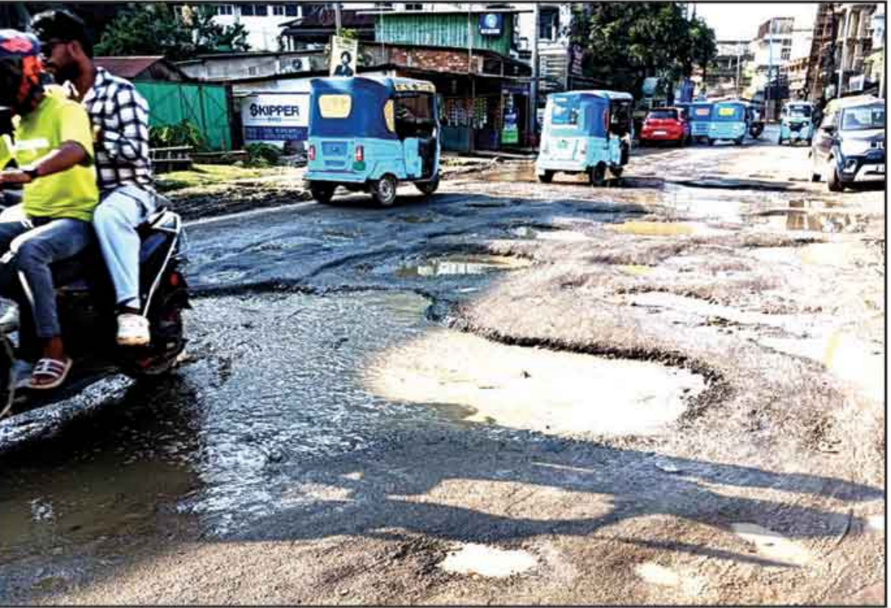
শিলচর-মেডিক্যাল সড়কে গর্তের মিছিল। চলাচলে দুর্ভোগ চরমে।