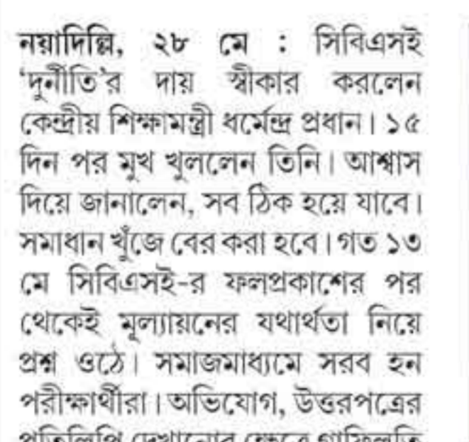
নয়াদিল্লি, ২৮ মে : সিবিএসই 'দুর্নীতি'র দায় স্বীকার করলেন কেন্দ্রীয় শিক্ষামন্ত্রী ধর্মেন্দ্র প্রধান। ১৫ দিন পর মুখ খুললেন তিনি।

সিবিএসই-র ফলপ্রকাশের পর থেকেই মূল্যায়নের স্বার্থপরতা নিয়ে প্রশ্ন ওঠে। সমাজমাধ্যমে সরব হন পরীক্ষার্থীরা। অভিযোগ, উত্তরপত্রের প্রতিলিপি দেখানোর ক্ষেত্রে গাফিলতি রয়েছে। বিতর্কের মাঝেই নড়েচড়ে বসে সর্বভারতীয় বোর্ড। যদিও এ বিষয়ে এতদিন কোনও মন্তব্য করেননি ধর্মেন্দ্র। বৃহস্পতিবার প্রথম মুখ খুলেন কেন্দ্রীয় শিক্ষামন্ত্রী। তিনি বলেন, 'সমস্ত দায়িত্ব আমি নিচ্ছি। সমাধান