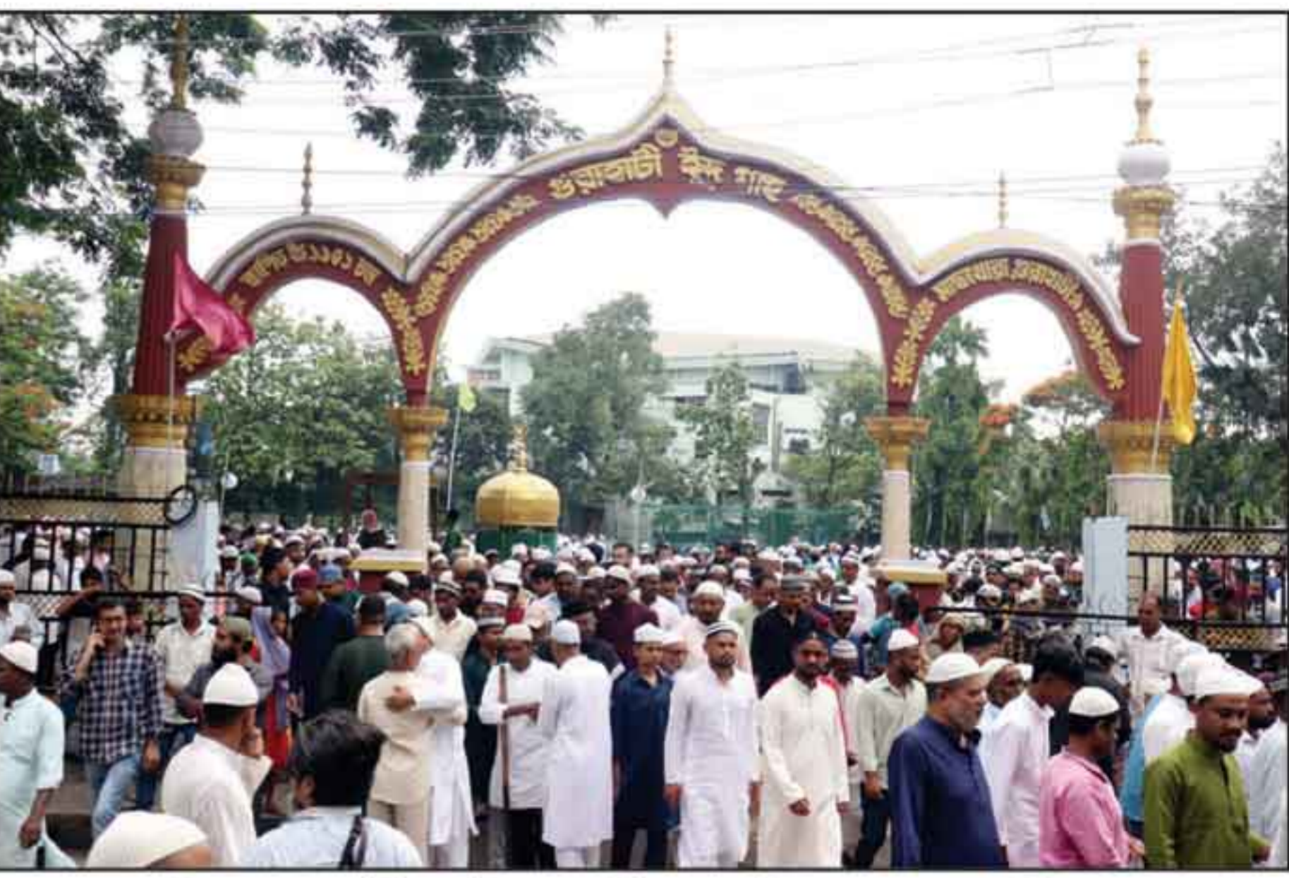
ঈদের জামাতে সামিল মুসল্লিরা। গুয়াহাটি মাছখোয়া ঈদগাহ ময়দানে বৃহস্পতিবার।

সামাজিক ব্যবস্থার কেন্দ্রে সবসময়ই নারীশক্তি মর্যাদা, নেতৃত্ব এবং সম্মানের আসনে অধিষ্ঠিত থেকেছে।' তিনি আরও বলেন, 'পরম্পরাগত অধিকার, নিয়ন্ত্রিত সামাজিক কাঠামো এবং নিজস্ব বিচারব্যবস্থা; এই সব দিক থেকেই অসমের পার্বত্য উপজাতি সমাজ আমাদের সকলের জন্য এক অনুকরণীয় উদাহরণ। ইউসিসির আওতার বাইরে রেখে তাদের সংস্কৃতির স্বকীয়তাকে সম্মান জানানোই আমাদের মূল উদ্দেশ্য।' মুখ্যমন্ত্রীর দাবি, বহু আগেই পার্বত্য উপজাতি সমাজ নিজেদের প্রথাগত আইন ও সামাজিক নিয়মের মাধ্যমে নারীর সুরক্ষা, বিবাহ ব্যবস্থা এবং পরিবারিক অধিকারের বিষয়গুলো নিয়ন্ত্রণ করে আসছে। এরপর ছয়ের পাতায়