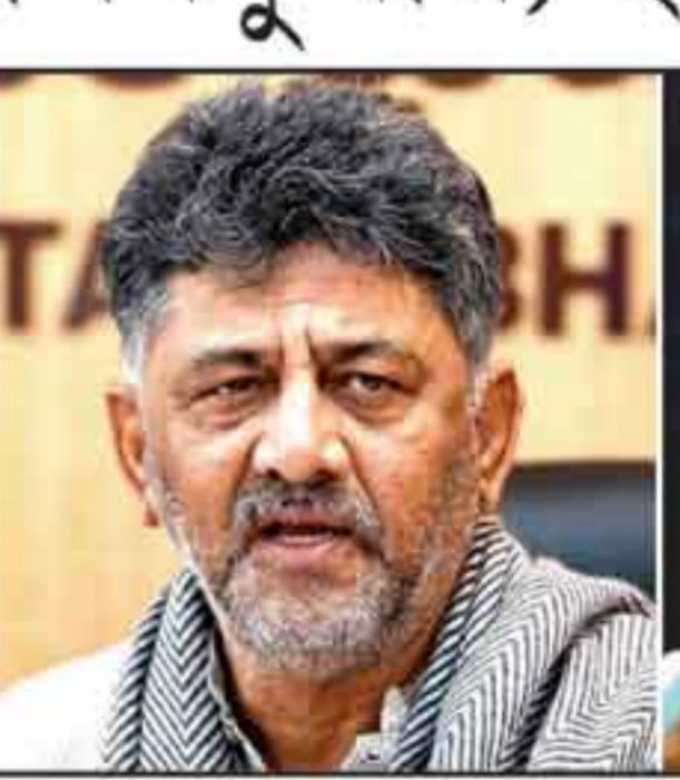
বেঙ্গালুরু, ২৮ মে : জঙ্গনার অবসান। বৃহস্পতিবার কর্ণাটকের মুখ্যমন্ত্রী পদে ইস্তফা দিলেন শিবকুমার। তার উত্তরসূরি হচ্ছেন ডিকে শিবকুমার। তিনি নিজেই একথা ঘোষণা করেছেন। অন্যদিকে, মুখ্যমন্ত্রী পদে ইস্তফা দিয়ে রাজসভার প্রস্তাবও ফিরিয়েছেন বসীয়ান কংগ্রেস নেতা। বৃহস্পতিবার সকালে মন্ত্রিসভার সদস্যদের সঙ্গে প্রাতঃসভা বৈঠকে বসেন সিদ্ধা। সেখানে উপস্থিত

ছিলেন শিবকুমারও। ওই বৈঠকেই বসীয়ান কংগ্রেস নেতা ইস্তফা দেওয়ার কথা ঘোষণা করেন। পাশাপাশি, উত্তরসূরি হিসাবে শিবকুমারের নাম অনুমোদন করেন। বৈঠক শেষে সিদ্ধার পা ছুঁয়ে প্রথম করেন শিবকুমার। এরপরই লোকভবনে গিয়ে ইস্তফা গ্ৰহণ করেন সিদ্ধা। যদিও সেখানে উপস্থিত ছিলেন না রাজপাল খাওয়ারচাঁদ গেলহাট। রাজ্যপালের সচিবের হাতে এরপর ছয়ের পাতায়