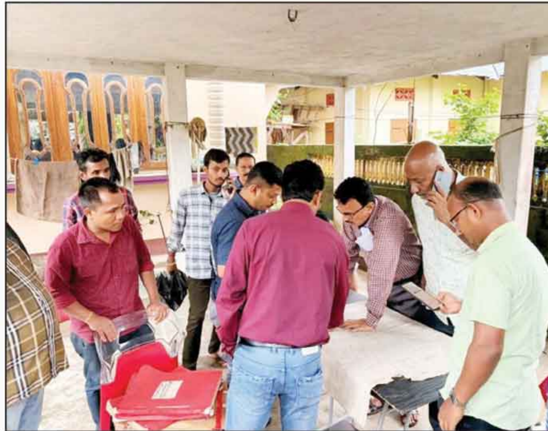
ব্রজেন্দ্র রোড এলাকায় চলছে জরিপের কাজ।

শ্রীভূমি, ২৭ মে : কৃত্রিম বন্যা থেকে ব্রজেন্দ্র রোডবাসীকে পরিদ্রাণ প্রদানে এবার মাঠে নামল পুরসভা। পুরসভার আবেদনে সরকারি জমি জবরদখল মুক্ত করতে বুধবার ব্রজেন্দ্র রোড এলাকায় মাপজোখ করা হয়। সদর সার্কল অফিসারের উপস্থিতিতে শতাব্দী প্রাচীন মাপ নিয়ে এলাকার কিছু ঘরবাড়ি চিহ্নিত করেন কর্মীরা। তবে নির্ধারিত একস্থান থেকে নয়, মধ্যভাগ থেকে যেমনখুশি তেমনি মাপজোখ করে লাল চিহ্ন বসিয়েছেন সার্কল অফিসারের কর্মীরা বলে অভিযোগ স্থানীয়দের। কয়েক ঘণ্টার ব্যস্ততা শহরের সিংহভাগ এলাকায় কৃত্রিম বন্যা ডুবে যায়। বিশেষ করে নালা নর্দমা বন্ধ থাকায় জমাজলে চরম ভোগান্তির মুখে পড়তে হয় সাধারণ মানুষকে। শহরের ব্রজেন্দ্র রোড এলাকায় বার বার জমাজল ঘরবাড়িতে প্রবেশ করে সাধারণ মানুষকে দুর্ভোগের মুখে ঠেলে দেয়। বাধা হয়ে স্থানীয়রা আন্দোলনে নামেন এবং টনক পড়ে পুরসভায়। শুরু হয় নালা নর্দমা সাফাই করার কাজ। গত ২৫ মে পুরসভার তরফে সদর সার্কল অফিসারের কাছে পত্র যোগাতে ব্রজেন্দ্র রোড, রমণীরোড এলাকায় সরকারি জমি জবরদখল মুক্ত প্রয়োজনীয় পদক্ষেপ গ্রহণের আবেদন জানানো হয়। পুরসভার তরফে বিজ্ঞপ্তি মারফত স্থানীয়দের অবগত করা হয় যে সরকারি জমির উপর যেসব ঘরবাড়ি, লোকনাট ও বাড়ির