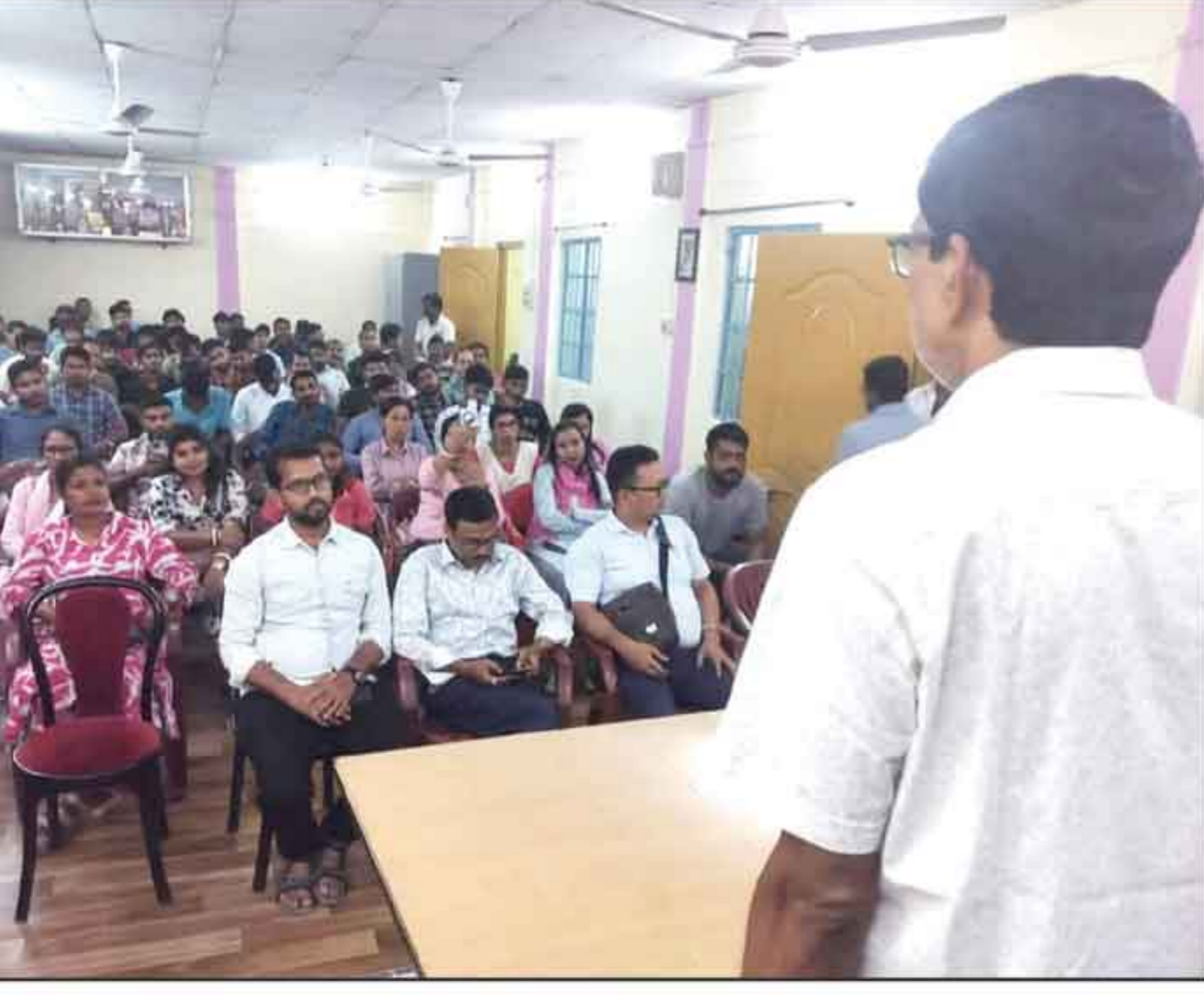
সভায় ভাষণ দিচ্ছে জনৈক ইউনিয়ন নেতা।

সভায় সংগঠনকে আরও শক্তিশালী করা, বিজেএম-এর প্রস্তুতি, সদস্যদের মধ্যে সমন্বয় বৃদ্ধি এবং ভবিষ্যৎ কর্মসূচি নিয়ে গুরুত্বপূর্ণ আলোচনা অনুষ্ঠিত হয়। দীর্ঘ সময় পর ইউনিয়নের এই সভায় বিপুল সংখ্যক উৎসাহী কর্মকর্তার উপস্থিতি সংগঠনের মধ্যে নতুন উদ্দীপনা সৃষ্টি করেছে বলে মনে করছে নেতৃত্ব।