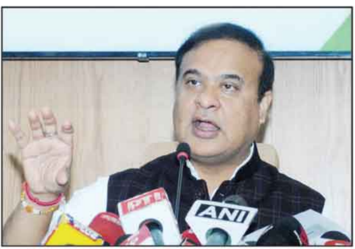
বৃহস্পতিবার সামাজিক মাধ্যমে এবং বিভিন্ন বক্তব্যে নিজের অবস্থান স্পষ্ট করেন মুখ্যমন্ত্রী। হিমন্ত বলেন, 'প্রাচীন সময় থেকে আমাদের পার্বত্য উপজাতি সমাজ নিজেদের স্বতন্ত্র পরম্পরা, বিশ্বাস, সংস্কৃতি এবং সামাজিক মূল্যবোধকে যত্ন সহকারে রক্ষা করে আসছে। এই সুদৃঢ়

সাময়িক প্রসঙ্গ, গুয়াহাটি, ২৮ মে : প্রাচীন সময় থেকেই পার্বত্য উপজাতি সম্প্রদায়ের সমাজে নারীদের অধিকার, মর্যাদা এবং সামাজিক সুরক্ষাকে বিশেষ গুরুত্ব দেওয়া হয়েছে। সেই কারণেই ইউনিফর্ম সিভিল কোড (ইউসিসি)-এর আওতার বাইরে রাখা হয়েছে তফসিলি উপজাতিদের, বৃহস্পতিবার এমনটাই জানালেন মুখ্যমন্ত্রী হিমন্ত বিশ্ব শর্মা।