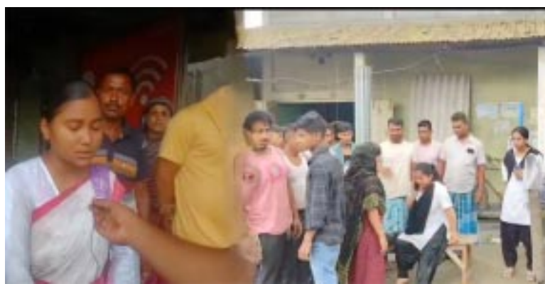
উত্থাপিত হৈছে। প্ৰতিদিনে হাজাৰ-হাজাৰ স্কুল-কলেজীয়া ছাত্ৰ-ছাত্ৰী আৰু সাধাৰণ কৰ্তৃপক্ষক অতি শীঘ্ৰে ৰাষ্ট্ৰীয় ঘাইপথটো পথেৰে যাতায়ত কৰিবলগীয়া হয়। ছাত্ৰ-ছাত্ৰী, অভিভাৱক তথা স্থানীয় ৰাইজে জিলা আয়ুক্ত আৰু সংশ্লিষ্ট বিভাগীয় কৰ্তৃপক্ষক অতি শীঘ্ৰে ৰাষ্ট্ৰীয় ঘাইপথটো মেৰামতি কৰাৰ বাবে দাবী জনাইছে।

বাতৰি কাকত, মুকালমুৱা, ৪ জুন : নলবাৰী জিলাৰ মুকালমুৱাৰ বৰলিয়াৰপাৰত জৰাজীৰ্ণ পথৰ ফলতে সঘনাই দুৰ্ঘটনা সংঘটিত হোৱাৰ অভিযোগ স্থানীয় ৰাইজৰ। নলবাৰী জিলাৰ নৱগঠিত ৪০ নং টিছ বিধানসভা সমষ্টিৰ অন্তৰ্ভুক্ত হোৱা গুৱাহাটীৰ পৰা মুকালমুৱা হৈ বৰপেটা সংযোগী পথটো ৪২৭ নং ৰাষ্ট্ৰীয় ঘাইপথত অন্তৰ্ভুক্ত কৰা হৈছে যদিও পথটিৰ বৰলিয়াৰপাৰ মূল চক্ৰকটো আজিকোপতি মেৰামতি কৰিবলৈ সক্ষম নহ'ল। ফলত উক্ত পথটো আজিও জৰাজীৰ্ণ হৈয়েই ব'ল। এই অতি ব্যস্ততাপূৰ্ণ পথটোত আজি স্কুল-কলেজীয়া ছাত্ৰী কঢ়িয়াই নিয়া এখন ই-ৰিক্সা বাগৰি পৰাৰ ফলত মুকালমুৱাস্থিত