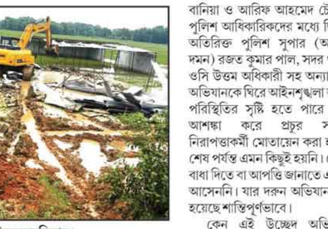
চলছে প্রশাসনের উচ্ছেদ অভিযান।

যেতে থাকে একের পর একটি ঘর। অভিযান চলে দুপুর প্রায় সাড়ে ১২টা পর্যন্ত। সবমিলিয়ে গুঁড়িয়ে দেওয়া হয় প্রায় শ'খানেক ঘর। এদিনের এই অভিযানের পর আগামীকাল শনিবার সংলগ্ন কাশীপুর দ্বিতীয় খণ্ড এলাকায়