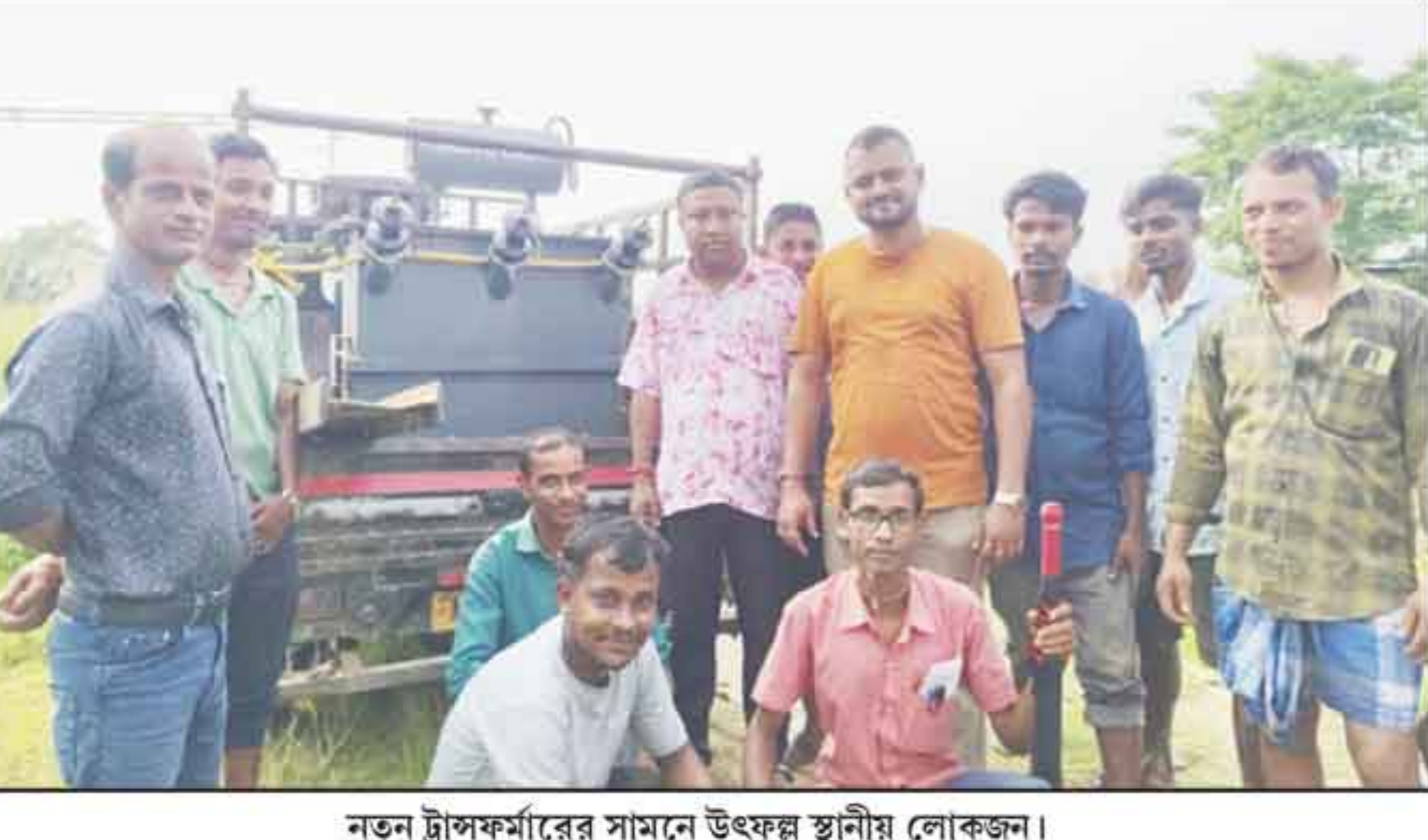
নতুন ট্রান্সফর্মারের সামনে উৎফুল্ল স্থানীয় লোকজন।