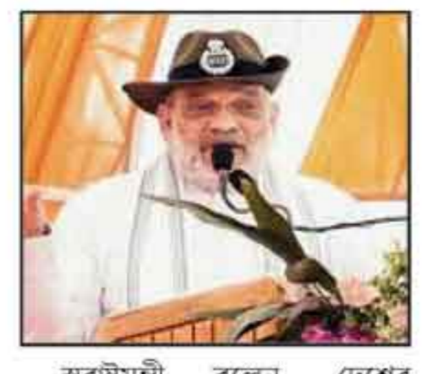
স্বরাষ্ট্রমন্ত্রী বলেন, দেশের আন্তর্জাতিক সীমান্ত রক্ষায় বিদ্যমান দুর্বলতা এবং ঘাটতিগুলি চিহ্নিত করে সেগুলি দূর করতে কেন্দ্রীয় সরকার

আগরতলা, ৫ জুন : সীমান্ত নিরাপত্তা জোরদার এবং অবৈধ অনুপ্রবেশ রোধে কেন্দ্রীয় সরকার আরও কঠোর ব্যবস্থা গ্রহণ করেছে। গুজুবীর ত্রিপুরা এবং বাংলাদেশ ভারত-বাংলাদেশ সীমান্তবর্তী লক্ষ্যমুড়া সীমান্ত চৌকিতে বিএসএফ জওয়ানদের উদ্দেশে ভাষণ দিতে গিয়ে কেন্দ্রীয় স্বরাষ্ট্রমন্ত্রী অমিত শাহ স্পষ্ট ভাষায় বলেন, পশ্চিমবঙ্গ, ত্রিপুরা এবং বিহারের মতো সীমান্তবর্তী রাজ্যগুলিতে জনসংখ্যার অস্বাভাবিক পরিবর্তন কোনওভাবেই মেনে নেওয়া হবে না।