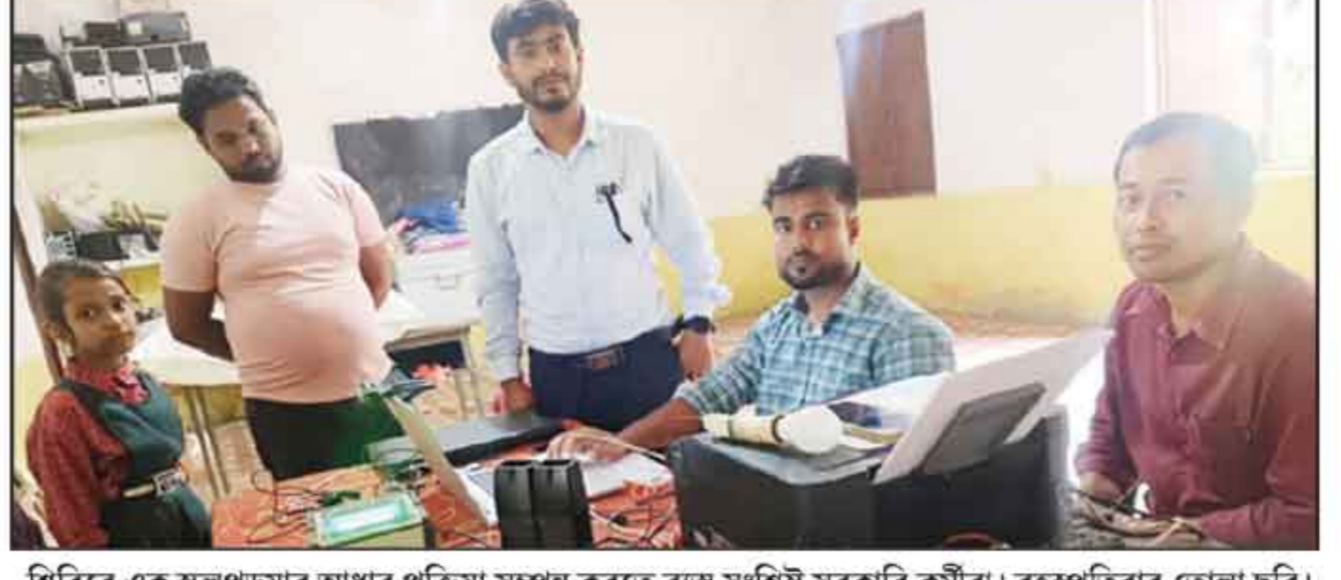
শিবিরে এক স্কুলপড়ায় আধার প্রক্রিয়া সম্পন্ন করতে ব্যস্ত সংশ্লিষ্ট সরকারি কর্মীরা। বৃহস্পতিবার তোলা ছবি।

কটামণি, ৫ জুন : ইউআইস ও আপার আইডি তৈরিতে আধার বাধ্যতামূলক হওয়ায় শিক্ষার্থীদের আধার নিবন্ধন ও সংশোধন নিয়ে যখন অভিভাবকদের মধ্যে ব্যস্ততা তুঙ্গে তিক তখনই তাদের সুবিধার্থে বিশেষ শিবিরের আয়োজন করে শ্রীভূমি জেলা প্রশাসন। পাথারকান্দির দুটি বিদ্যালয়ে আয়োজিত এই শিবিরে দিনভর ছিল অভিভাবক ও শিক্ষার্থীদের উপচেষ্টা ভিডি। শিক্ষার্থীদের আধার নিবন্ধন ও প্রয়োজনীয় তথ্য সংশোধনের লক্ষ্যে শ্রীভূমি জেলা প্রশাসনের এই উদ্যোগে বৃহস্পতিবার পাথারকান্দি রুক প্রাথমিক শিক্ষাখণ্ডের অধীন পাথারকান্দি শহরের গার্লস এমই স্কুল এবং প্রেমময়ী সিনিয়র বেসিক স্কুলে পৃথকভাবে দুটি বিশেষ আধার নিবন্ধন ও সংশোধন শিবির অনুষ্ঠিত হয়। সকাল থেকেই বৃহত্তর পাথারকান্দি এলাকার সরকারি ও বেসরকারি বিভিন্ন বিদ্যালয়ের শতাধিক অভিভাবক