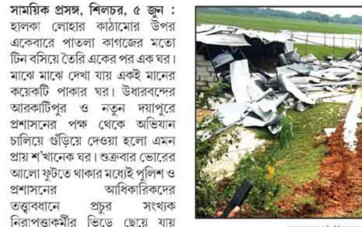
চলছে প্রশাসনের উচ্ছেদ অভিযান।

যেতে থাকে একের পর একটি ঘর। অভিযান চলে দুপুর প্রায় সাড়ে ১২টা পর্যন্ত। সবমিলিয়ে গুঁড়িয়ে দেওয়া হয় প্রায় শ'খানেক ঘর। এদিনের এই অভিযানের পর আগামীকাল শনিবার সংলগ্ন কাশীপুর দ্বিতীয় খণ্ড এলাকায়