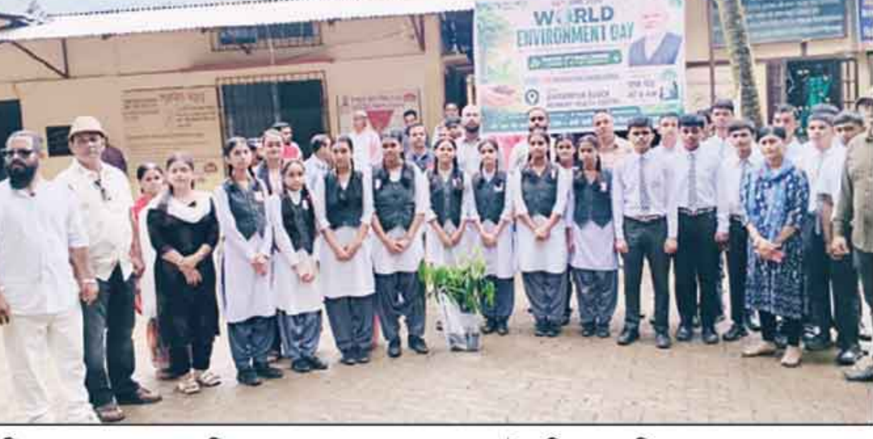
বিক্রমপুর রামকমল প্রাথমিক স্বাস্থ্যকেন্দ্রে বৃক্ষরোপণ ও সাফাই অভিযানে সামিল পড়ায় সহ অন্যান্যরা।