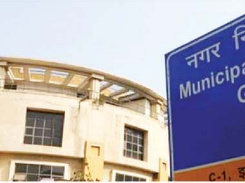
निकाय फिलहाल विभिन्न छोटे ठेकेदारों के माध्यम से अस्थायी उपायों के भरोसे ही पूरे शहर की सफाई व्यवस्था को चला रहा है। इस लचकर व्यवस्था के कारण शहर की दर्जनों सोसाइटीयों और रहियशी सेक्टरों में लोग निजी स्तर पर कचरा प्रबंधन करने को मजबूर हैं, जहाँ निजी कचरा उठाने

इकट्ठा करने, उसे अलग करने और उसके वैज्ञानिक निस्तारण की कोई स्थायी या सुचारु व्यवस्था नहीं है। नगर