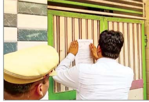
बाहर निकालकर कार्रवाई की गई। जिला अल्पसंख्यक कल्याण अधिकारी की ओर से चर्चा नोटिस के मुताबिक, दोनों मदरसे अवैध हैं और बिना मान्यता के चल रहे थे। मदरसा सोसाइटी का भी रजिस्ट्रेशन उपलब्ध नहीं कराया गया है? इसके अलावा अग्निशमन विभाग और विद्युत सुरक्षा विभाग से भी एनओसी नहीं ली गई है। संचालकों को नोटिस देकर सात दिन में जवाब मांगा गया है। जवाब न दिए